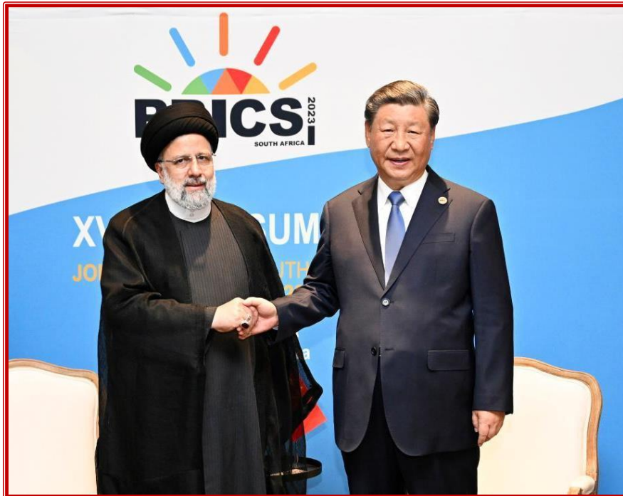
Πηγή: Xinhua/Xie Huanchi, 24 Αυγούστου 2023.

Για το Ιράν, η είσοδος στον εν λόγω Οργανισμό αποτελεί ένα μήνυμα τόσο για το εσωτερικό όσο και για το εξωτερικό. Στο εσωτερικό, παρουσιάζεται ως μια νίκη του καθεστώτος που δυνητικά μπορεί να ενδυναμώσει τη διεθνή θέση του κράτους. Η εργαλειακή χρήση της εισόδου στον Οργανισμό αποτελεί μια προσπάθεια της κυβέρνησης να βάλει ένα τέλος στις επικρίσεις των εναπομεινάντων μετριοπαθών φωνών στο Κοινοβούλιο και των αγανακτισμένων πολιτών, εξαιτίας των αυταρχικών πολιτικών του καθεστώτος 8 . Η προσέλκυση νέων επενδυτών και η βελτίωση του ισοζυγίου τρεχουσών συναλλαγών εκτιμάται ότι μπορεί να δημιουργήσει νέες θέσεις εργασίας, να βγάλει το Ιράν από τη χρόνια απομόνωσή του λόγω των δυτικών κυρώσεων και να οδηγήσει την ιρανική κοινωνία σε μια συνολικότερη ευμάρεια. Στην ουσία, πρόκειται, μάλλον, για μια συμβολική νίκη δημιουργίας θετικών εντυπώσεων στο εσωτερικό. Είναι αμφίβολο αν οι Η.Π.Α. θα επέτρεπαν ποτέ να αναπτύξει το Ιράν τόσο στενές οικονομικές σχέσεις με χώρες του Οργανισμού που εξαρτώνται άμεσα από αμερικανικά κεφάλαια και επενδύσεις. Η ύπαρξη δευτερευουσών κυρώσεων στα κράτη και στις επιχειρήσεις που συνάπτουν σχέσεις με το Ιράν είναι πολύ πιθανό να αποτελέσει ανασταλτικό παράγοντα της όποιας προόδου θέλει να προβάλει η Τεχεράνη στο εσωτερικό, ούτως ώστε να καμφθούν ευκολότερα οι αντικαθεστωτικές φωνές 9 .